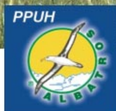
Zakład Przetwórstwa Ryb „Albatros” w Nienadówce „Albatros” Seafood Processing Plant in Nienadówka

T he Sokołów Commune is predominantly a farming region. There are 3,394 farming estates of the average size - 3.75 hectares. The majority of farming grounds are included in the 4th and 5th soil class. Over a half of arable grounds (4,818 hectares) have drainage systems. The main type of plant growing includes grains and root plants, and in the southern part - Nienadówka, Trzeboś and Trzebuska - also strawberries. Animal breeding includes mostly pigs and cattle.