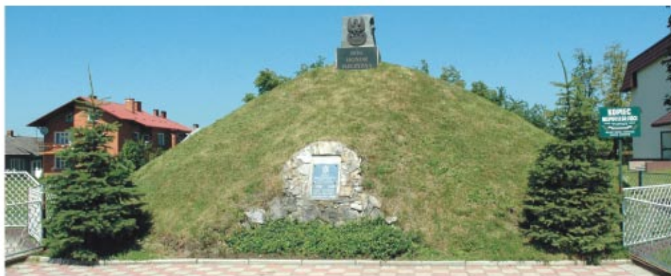
Kopiec Niepodległości w Trzeboś The Maund of Independence in Trzeboś

Wydawca: Gmina Sokółów Młp. ul. Rynek 1, 36-050 Sokółów Młp. Projekt dofinansowany ze środków Unii Europejskiej w ramach Programu Sąsiedztwa Polska-Białoruś-Ukraina INTERREG III A/TACIS CBC 2004-2006 Tekst: dr Bartosz Walicki Projekt i druk: DUET, tel. (017) 87 11 281, 863 55 44