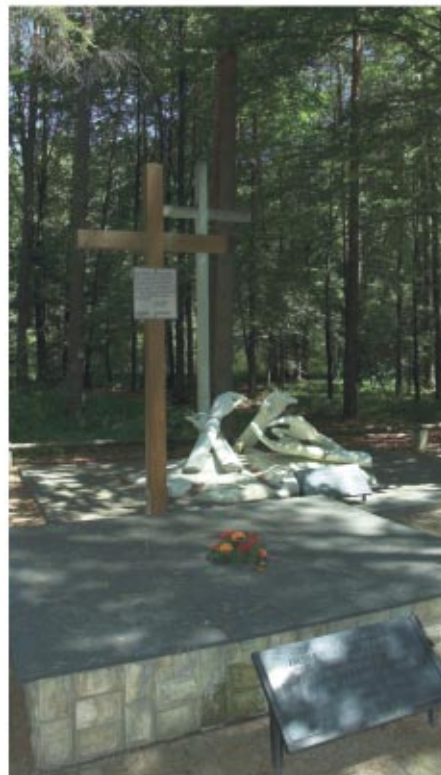
Miejsce pamięci w Lesie Turzańskim Memorial place in Turzański Forest