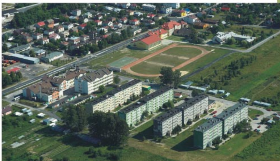
Obiekt sportowy sokołowskich szkół School sport facilities in Sokółów

T he Sokółów Region is located in the area of the old Sandomierz Primeval Forest and it is very attractive for tourists. In the Renaissance town you can admire 18th century chapels, the Town Hall from 1907, many souvenirs of wooden and brick architecture. It is worth visiting the beautiful churches - a wooden church in Wólka Niedźwiedzka from 1607 (transferred here from Wola Zarczycka) and the brick churches: in Trzeboś and Nienadówka, both from the 19th century, and in Górno and Sokółów Małopolski, both from the early 20th century. In the whole area of Sokółów Region there are numerous historic chapels, roadside crosses and figures, some of those dating back from the 18th century.