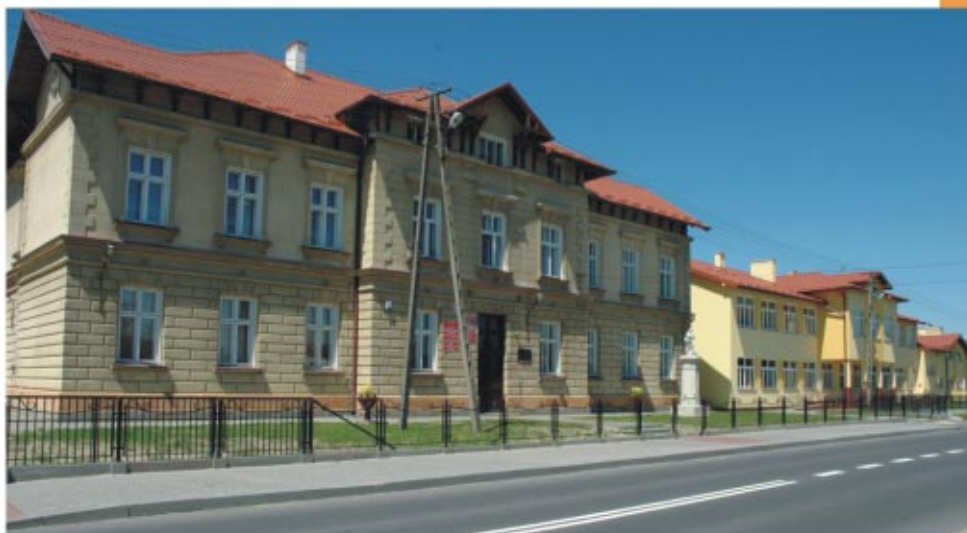
Ponadgimnazjalny Zespół Szkół w Sokółowie Małopolskim The complex of secondary schools in Sokółów Małopolski

T he Sokółów Commune meets educational needs of children and teenagers. There are educational complexes comprising primary schools and public gimnasiums. John Paul II School in Sokółów Małopolski, M. Lachor School in Górne, H. Sienkiewicz School in Nienadówka, and schools in Nienadówka, Trzeboś, Trzebuska and Wólka Niedźwiedzka. Some of those complexes comprise also kindergartens financed by the local government. Besides that, in the small villages of Górno-Zaborze, Trzeboś, Turza and Wólka Sokółowska - there are four primary schools.