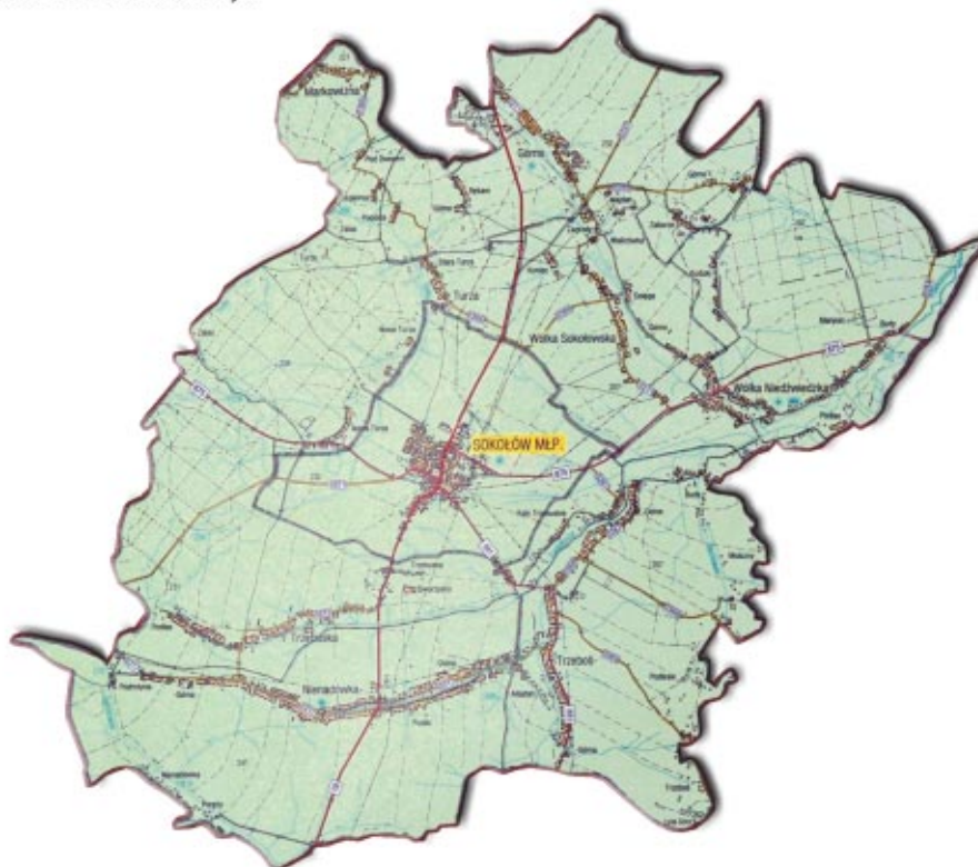
Mapa Gminy Sokółów Małopolski The map of the Sokółów Małopolski Commune

Gmina sokołowska jest w całości zgazyfikowana i stelefonizowana. Trwa budowa sieci kanalizacji sanitarnej. W mieście funkcjonuje Komisariat Policji obsługujący gminy Sokółów Młp. i Kamień. Istniejące w każdej miejscowości jednostki Ochotniczej Straży Pożarnej zrzeszone są w Związku Miejsko-Gminnym. Swoje komórki posiadają tu również Powiatowy Urząd Pracy w Rzeszowie oraz Referat Komunikacji.