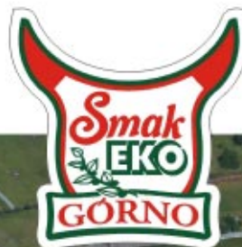
Zakład Mięсны „Smak-Eko” w Górnio „Smak-Eko” Meat Processing Plant in Górnio

W Sokołowie Młp. działają: Podkarpacka Fabryka Okien „OKNO-RES”, Zakład Przetwórstwa Tworzyw „CONNECT”, Zakład Pończoszniczo-Dziewiarski „KARINA”, Zakład Mięсны „MAŁOPOLSKA”, FPH „MARKOREW”, PH.U. „KANPOL”, PPH „CERAMIX”, Z.PH. „LIMET”, Z.U.PH. „GWINTMAR” i PPH „ACCORD”. Ponadto do miejscowych potentatów gospodarczych należą m.in.: Zakład Mięсны „SMAK-EKO” w Górnio, Zakład Mleczarski „NOWOŚĆ” w Trzebusce i Zakład Przetwórstwa Ryb „ALBATROS” w Nienadówce.