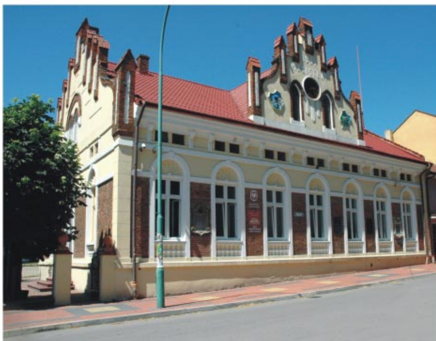
Magistrat w Sokołowie Małopolskim - siedziba władz gminnych The Town Hall in Sokołów Małopolski - the seat of local authorities

T he Sokołów Commune is one of 14 communes of the Rzeszów District and 160 communes of the Podkarpackie Province. It consists of the town of Sokołów Małopolski and 10 villages: Górno, Kąty Trzebuskie, Markowizna, Nienadówka, Trzeboś, Trzeboś Podlas, Trzebuska, Turza, Wólka Niedźwiedzka and Wólka Sokołowska. The commune covers the area of 134.1 square kilometres, including 15.6 square kilometres of the town area. Today the population of the town is 4,041 people, and the total population of the villages is 12,667 people. The average density of population in the urban part is 258.6 people per square kilometre, and in the rural areas - 106.5 people per square kilometre.