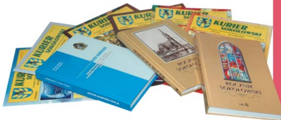
Regionalne wydawnictwa Local publications

Cultural activities as well as sport and recreation are organised and coordinated by the Town and Community Centre for Culture, Sport and Recreation. It is located in the building of the former synagogue in Sokołów Małopolski, and there are nine community centre day rooms in villages. The Culture Centre organises periodic cultural events of the commune, district and province range. It also organises clubs for various activities, including arts, dancing and music performance. Besides that various types of sport activities are promoted as well as active recreation (these include aerobics, table tennis and chess sections).