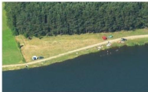
Zalew „Niedźwiadek” w Wólce Niedźwiedzkiej The „Niedźwiadek” Lake in Wólka Niedźwiedzka