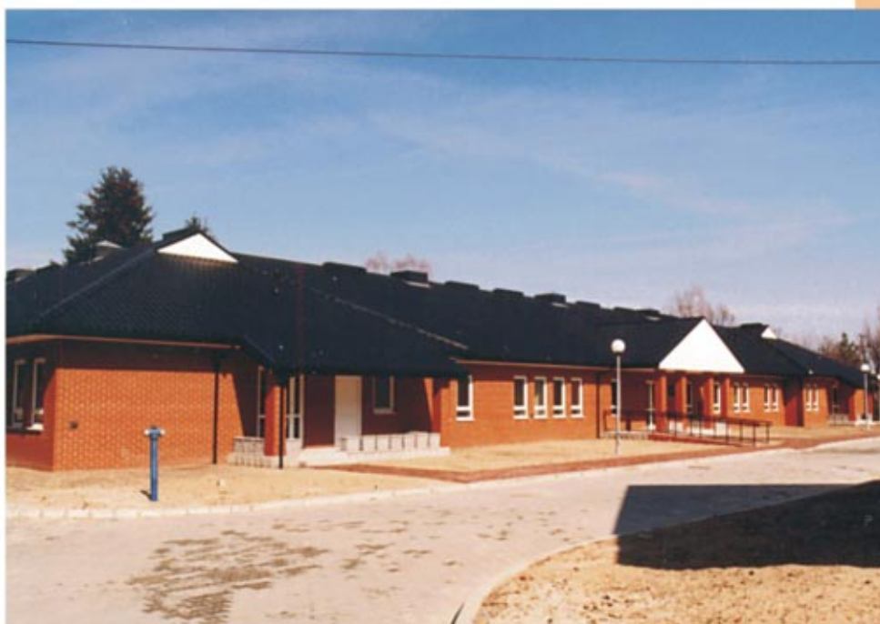
Hospicjum „Dom Sue Ryder” w Górnio „Sue Ryder Home” hospice

T here is the Regional Health Centre in the town, and the Private Health Centre with branches in Górnio, Trzeboś and Wólka Niedźwiedzka. A Public Health Centre is located in Nienadówka. Górnio houses a medical complex - Independent Public Complex of Health Centres „Sanatorium” which consists of „Sue Ryder Home” Hospice, Health Care Centre, and the Tuberculosis and Lung Diseases Ward. In the vicinity there is also the Welfare Centre. In Turza there is a private Old People's Home „Leśniówka”. In Sokołów there are two private chemist's shops, there are also chemist's shops in Górnio and Nienadówka.