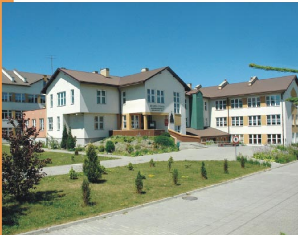
Zespół Szkół im. Jana Pawła II w Sokołowie Małopolskim John Paul II School complex in Sokółka Małopolski

Przy szkołach funkcjonują boiska sportowe, stale trwa też rozbudowa i unowocześnianie bazy dydaktycznej. Uczniowie korzystają z kółek przedmiotowych i realizują swoje zainteresowania w ramach zajęć pozalekcyjnych. Dzieci i młodzież mogą również rozwijać swe zdolności w miejscowej Niepaństwowej Szkole Muzycznej I stopnia.