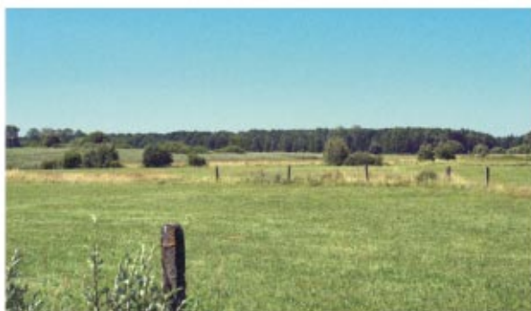
Ziemia sokołowska Соколувська земля

Гміна Соколув Малопольський знаходиться на півночі Жешувського повіту у Підкарпатському воєводстві, 24 км на північ від Жешува. Розташована у розвилині Вісли і Сану, на Кольбушовському плоскогір'ї, у т.зв. Соколувській мульдї. Займає поверхню площею 134,1 км 2 , з чого 31,3 км 2 це ліси, а 95,3 км 2 земельні угіддя. Місто Соколув Малопольський знаходиться на перехресті п'яти доріг, які ведуть в напрямку: Жешува, Кольбушової, Лежайська, Ланьцута і Любліна. Місто оточене селами. Добре функціонує тут мережа автобусних сполучень в рамках державних і приватних ліній.