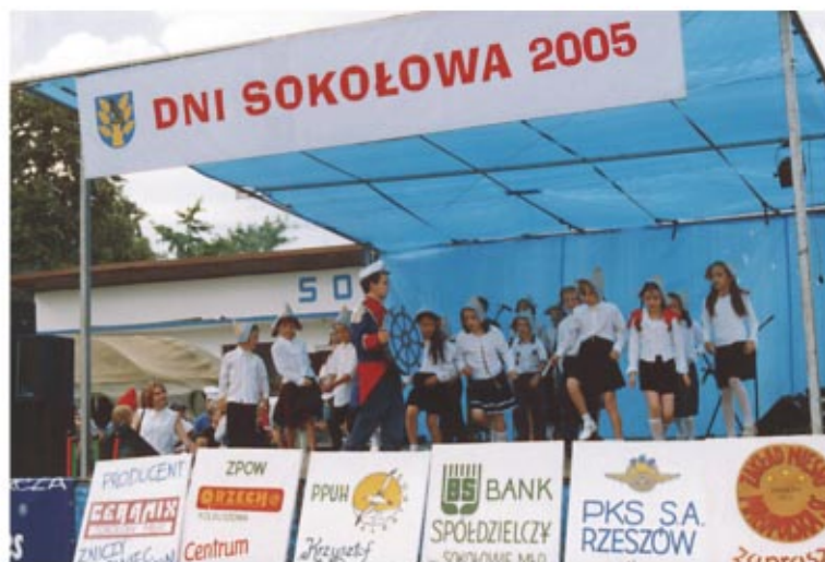
Występy podczas „Dni Sokołowa 2005” Виступи підчас „Дні Соколува 2005”

Gmina sokołowska posiada szereg wydawnictw mówiących o jej przeszłości oraz teraźniejszości. Od listopada 1992 roku Towarzystwo i Ośrodek Kultury systematycznie wydają miesięcznik społeczno-kulturalny „Kurier Sokołowski”. Do tej pory opublikowano też sześć numerów „Rocznika Sokołowskiego”. Wydane zostały dwa tomy opowieści o regionie oraz monografie Koła Łowieckiego, Banku Spółdzielczego, klubu sportowego. Oprócz tego spisane zostały dzieje Górnika i Trzebośi oraz opublikowano zbiory poezji miejscowych twórców.