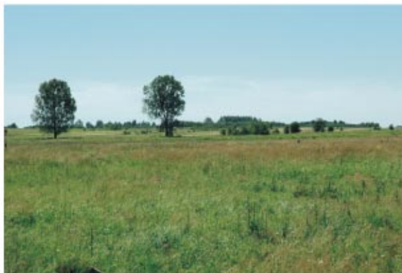
Ziemia sokołowska Соколувська земля

Ziemia sokołowska znajduje się w zlewni rzek: Turki, Trzebońnicy i Świerkowca. Na jej północy przeważają piaski, na południu gliny, zaś w dolinach rzek - utwory aluwialne pyłowo-piaszczyste. Gmina jest bogata w kompleksy leśne dawnej Puszczy Sandomierskiej. Lasy iglaste zajmują ok. 23% powierzchni gminy. Obfitują w bogate runo leśne i faunę. Sokołowszczyzna posiada łagodny klimat z niewielką ilością opadów; pozostaje pod wpływem powietrza kontynentalnego.