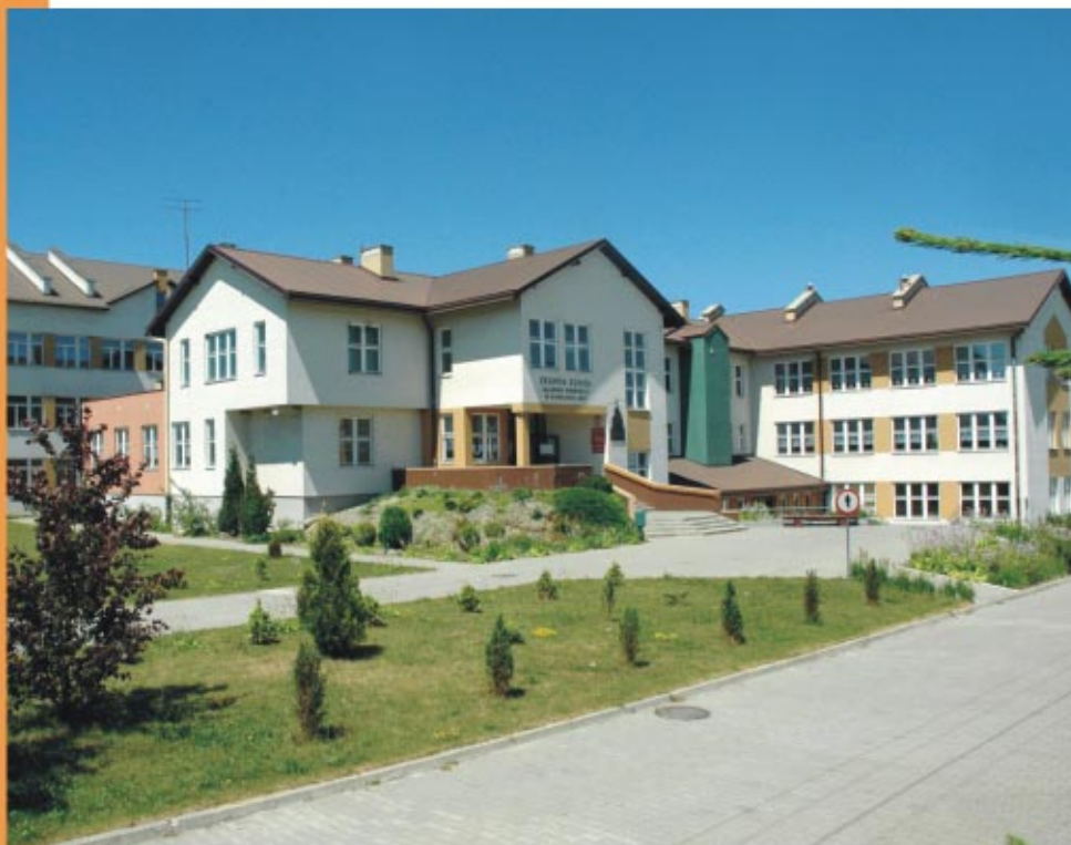
Zespół Szkół im. Jana Pawła II w Sokołowie Małopolskim Комплекс шкіл ім. Іоанна Павла II у Соколуві Малопольському

Przy szkołach funkcjonują boiska sportowe, stale trwa też rozbudowa i unowocześnianie bazy dydaktycznej. Uczniowie korzystają z kółek przedmiotowych i realizują swoje zainteresowania w ramach zajęć pozalekcyjnych. Dzieci i młodzież mogą również rozwijać swe zdolności w miejscowej Niepaństwowej Szkole Muzycznej I stopnia.