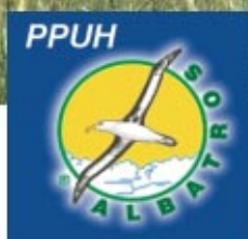
Zakład Przetwórstwa Ryb „Albatros” w Nienadówce Рибний завод „Albatros” у Ненадувці

Соколувська гміна має сільськогосподарський характер. На її терені функціонує 3.394 сільських господарств середньою площею 3,75 ha. Найчастіше зустрічаються землі IV і V класів. Понад половина земельних угідь (4818 га) меліорована. Вирощуються тут переважно зернові і просапні культури, а в південній частині Ненадувці, Тшебосі і Тшебусці також полуниця. У тваринництві домінує свинарство і скотарство.