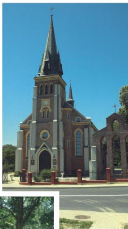
Kościół pw. Św. Bartłomieja w Nienadówce