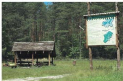
Parking w lesie w Turzy - fragment edukacyjnej ścieżki historyczno-przyrodniczej