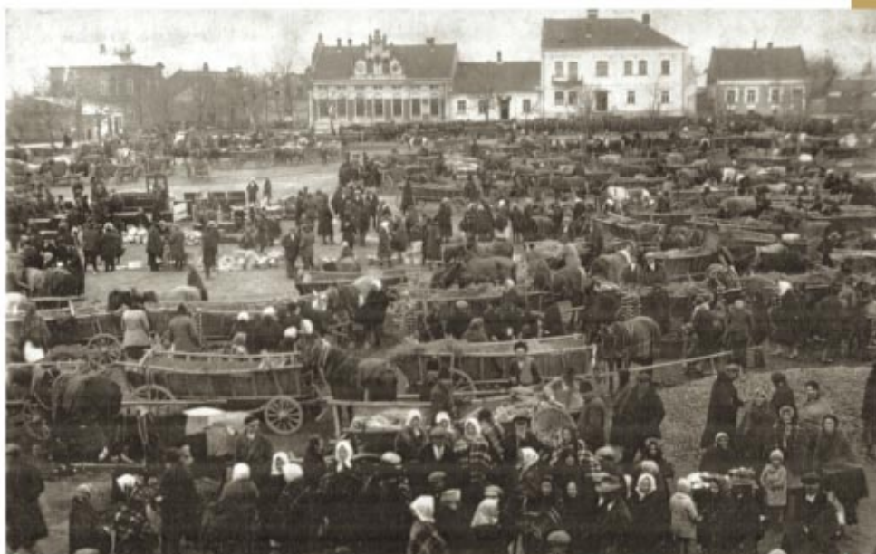
Jarmark na Rynku w Sokółowie - okres przedwojenny Ярмарок на Ринку у Соколуві - довоєнний час

М істо Соколув засновано в 1569 році старостою Яном Пілецьким. Міські права надав йому король Зигмунт Август. Місцем було старе поселення на перехресті торговельних шляхів: „Краківського” з Тарнува через Кшешув у Львів і „Мад’ярського” з Сандомира через Жешув і Дуклю в Угорщину. Про торговельно-ремісничий характер Соколува свідчило ренесансне розпланування мережі вулиць з центрально розташованим великим ринком.