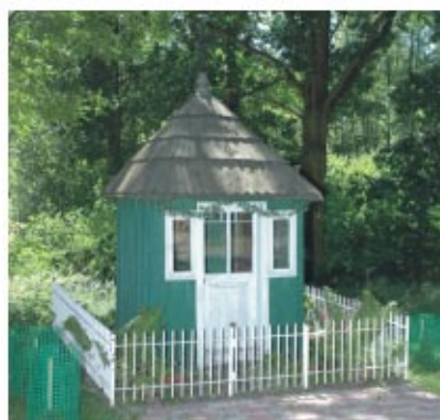
Zabytkowa kapliczka w Górnio Старовинна капличка в Гурне

Н а терені соколувської землі існує шість римсько-католицьких парафій: св. Іоанна Хрестителя в Соколуві Млп., введення во Храм Пресвятої Богородиці в Гурне, св. Варфоломея в Ненадувці, Провидіння у Тшебосі, Ченстоховської Божої Матері у Тшебусці і Королеви Польщі у Вульці Недзведзькій. Ці парафії, разом з п'ятьма іншими, входять у склад Соколувського деканату, який належить до Жешувської єпархії і існує з 1921 року. Більшість парафій має костели і каплиці. У Ненадувці і Соколуві Млп. свої чернецькі будинки мають Старовейські Сестри Служебниці. Окремий будинок капелана діє в лікувальних закладах в Гурно. Соколувський парафіяльний костел становить водночас святилище Божої Матері Королеви Світу зі славетним ласками образом Богоматері.