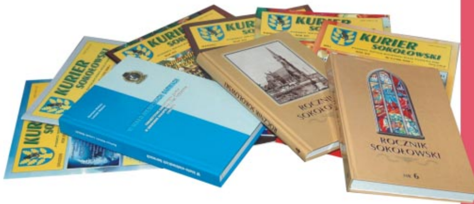
Regionalne wydawnictwa Регіональні видавництва

К ультурну і спортивно-рекреаційну діяльність у Соколувській гміні організує і координує гмінно-міський центр культури, спорту і рекреації. Центр знаходиться в будинку давньої синагоги у Соколуві Млп., а в селах діють дев'ять клубів. Центр культури організує постійні культурні міроприємства гмінного, повітового і воєводського рівней. Діють у ньому художні, танцювальні і вокально-інструментальні гуртки. Понадто популяризує різні види спорту і просуває активні форми відпочинку (м.ін. секції аеробіки, настільного тенісу, шахів).