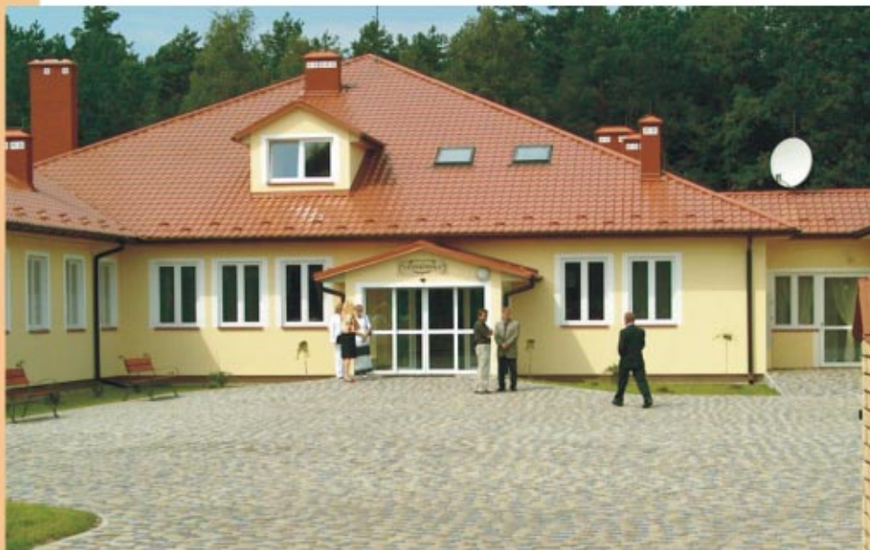
Dom Spokojnej Starości „Leśniówka” w Turzy Будинок спокійної старості „Lesniowka” у Туржі

Opiekę społeczną ludności zapewnia Miejsko-Gminny Ośrodek Pomocy Społecznej. Organizacjami pozarządowymi są Stowarzyszenie Pomocy Osobom Niepełnosprawnym i Klub Abstynenta „Diament”. Przy Urzędzie Gminy działa też Komisja ds. Rozwiązywania Problemów Alkoholowych. Ponadto w mieście funkcjonuje Środowiskowy Dom Samopomocy dla osób upośledzonych.