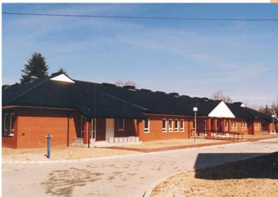
Hospicjum „Dom Sue Ryder” w Górnice Госпис „Dom Sue Ryder” у Гурне

Н а терені міста діють районна поліклініка і неpubлічний медичний заклад з відділеннями в Гурно, Тшебосі і Вульці Недзведзькій. Публічний медичний заклад знаходиться в Ненадувці. В Гурно функціонує медичний заклад публічний медичний комплекс "Санаторій", у склад якого входять госпис „Dom Sue Ryder", опікунсько-лікувальний заклад і відділення туберкульозу і хвороб легенів. Функціонує там також Будинок соціальної допомоги. В Тужі послуги надає приватний Будинок спокійної старості „Leśniówka". У Соколуві діють дві приватні аптеки, є також аптеки в Гурно і Ненадувці.