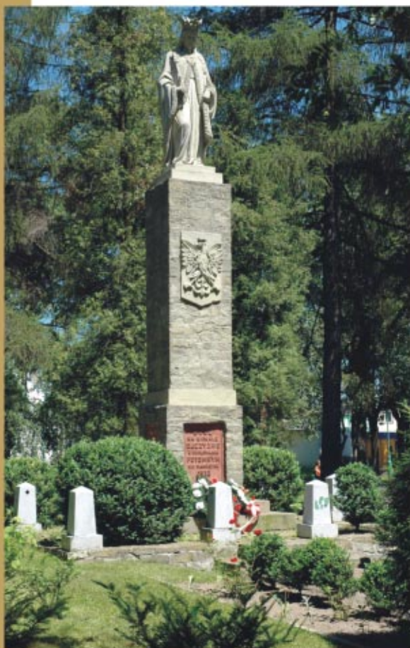
Pomnik Wdzięczności za Odzyskaną Wolność w sokołowskim Rynku

miejszem strajków i wystąpień chłopskich. Wojska niemieckie wkroczyły do Sokołowa 10 września 1939 r. W lipcu 1944 r. miasto zostało poważnie zniszczone przez niemieckie bombardowanie lotnicze. Jesienią tego roku w pobliskiej Trzebusce NKWD założyło przejściowy obóz dla jeńców wojennych, żołnierzy Armii Krajowej i przestępców. Niektórzy z nich zostali zamordowani i potajemnie zagrzebani w lasach turzańskich. Lata powojenne przyniosły powolną odbudowę i rozwój Sokołowa.