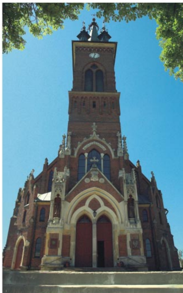
Kościół pw. Św. Jana Chrzciciela w Sokółowie Małopolskim - sanktu- arium Matki Bożej Królowej Świata

N a terenie ziemi sokołowskiej istnieje sześć parafii rzymskokatolickich: pw. Św. Jana Chrzciciela w Sokołowie Młp., pw. Ofiarowania Matki Bożej w Górnio, pw. Św. Bartłomieja w Nienadówco, pw. Opatrzności Bożej w Trzebosi, pw. Matki Bożej Częstochowskiej w Trzebusce i pw. Królowej Polski w Wólce Niedźwiedzkiej. Parafie te, razem z pięcioma innymi, wchodzą w skład Dekanatu Sokołowskiego należącego do Diecezji Rzeszowskiej, a istniejącego od 1921 roku. Większość parafii posiada kościoły i kaplice dojazdowe. W Nienadówco i Sokołowie Młp. swoje domy zakonne prowadzą Siostry Służebniczki Starowiejskie. Osobna kapelania działa też przy zakładach leczniczych w Górnio. Sokołowski kościół parafialny stanowi zarazem sanktuarium Matki Bożej Królowej Świata z łaskami słynącym wizerunkiem maryjnym.