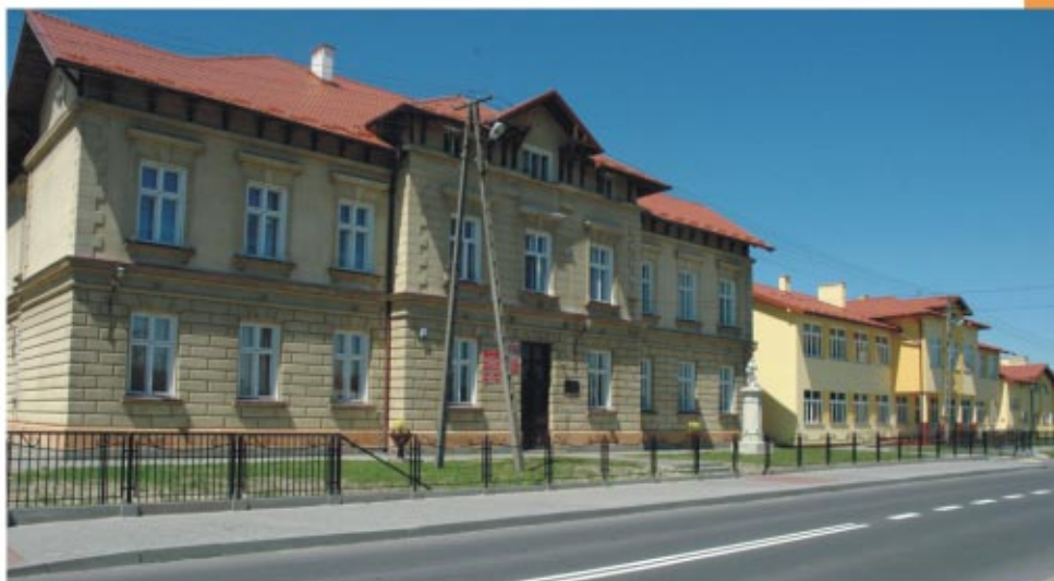
Ponadgimnazjalny Zespół Szkół w Sokolowie Małopolskim Понадгімназійний комплекс шкіл у Соколуві Малопольському

Соколувська гміна досконало задоволює освітні потреби дітей і молоді. Діють тут комплекси шкіл, у склад яких входять початкові школи, публічні гімназії: ім. Іоанна Павла II у Соколуві Млп., ім. кс. М. Лахора в Гурно, № 1 ім. Г. Сенкевича у Ненадувці, № 2 у Ненадувці, у Тшебосі, Тшебусці і Вульці Недзведзьській. При декількох з них функціонують також дитячі садки. У менших місцевостях Гурно-Забужі, Тшебосі, Тужі і Вульці Соколувській діють чотири початкові школи.